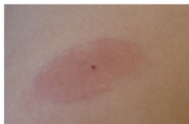
■ Erythema chronicum migrans